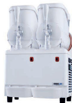
GRANISMART EVO 2